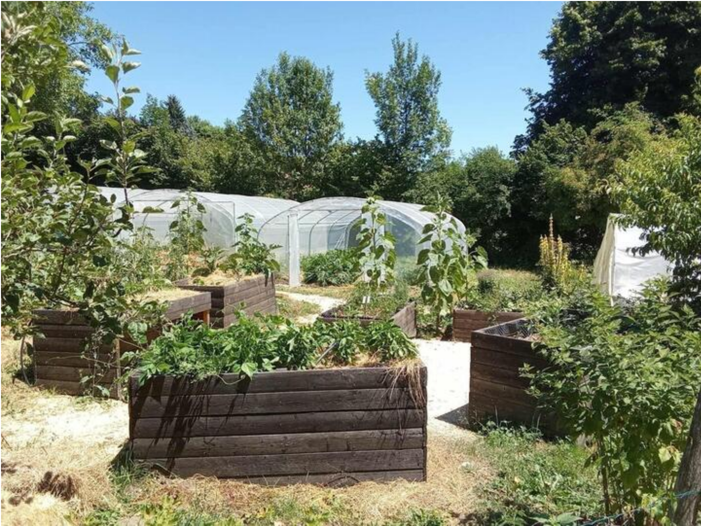
Les ateliers "Jardin en permaculture" 38160 Saint-Antoine-l'Abbaye Ateliers jardin en permaculture Plus d'infos mar. 21 avr.