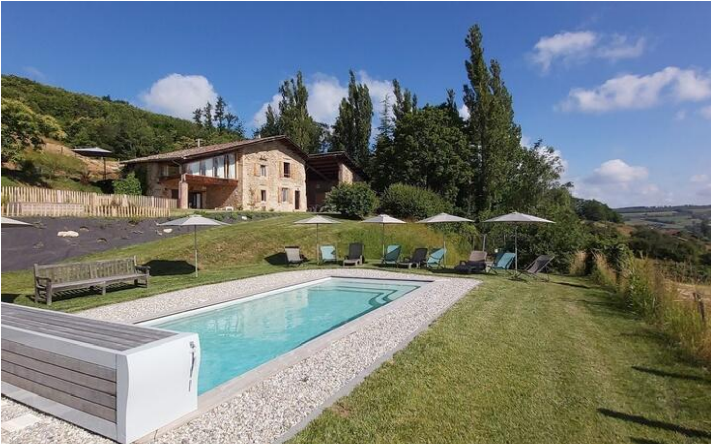
Gîte de Charme les Reynauds 38160 Saint-Antoine-l'Abbaye

Magnifique demeure de charme du 18 ème siècle, rénovée par architecte et parfaite pour vos week-ends, vacances, séminaires... Nichée tout en haut de la commune de Saint Antoine l'Abbaye, notre Gîte est située dans une zone naturelle protégée.