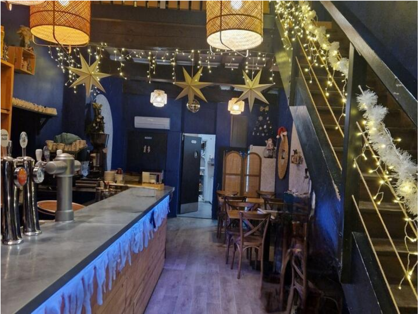
Les Tentations d'Antoine 38160 Saint-Antoine-l'Abbaye d'infos