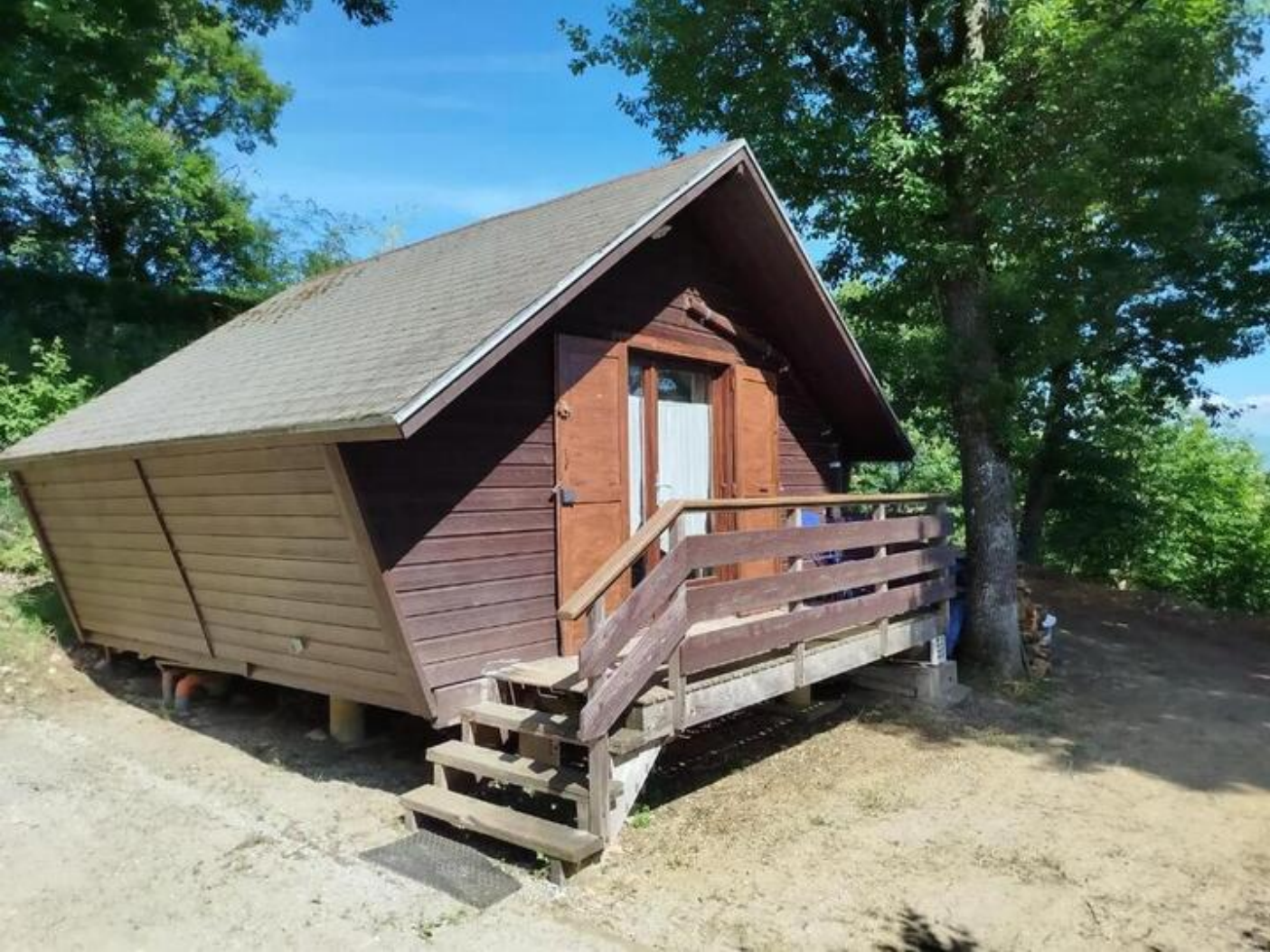
Chalet les genets 38160 Saint-Antoine-l'Abbaye d'infos