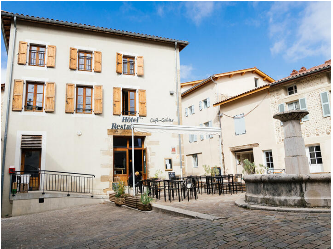
Le Bistrot de l'Hôtel Les Tanins 38160 Saint-Antoine-l'Abbaye

Le Bistrot - cave à vin de l'Hôtel Les Tanins vous propose de découvrir et déguster les produits de son épicerie fine alliant terroirs d'origines et d'adoptions. L'espace cave à vin, à emporter ou à consommer sur place avec un droit de bouchon, ainsi que notre carte de boissons variées seront les alliés idéaux pour accompagner vos moments de partage en famille ou entre amis.