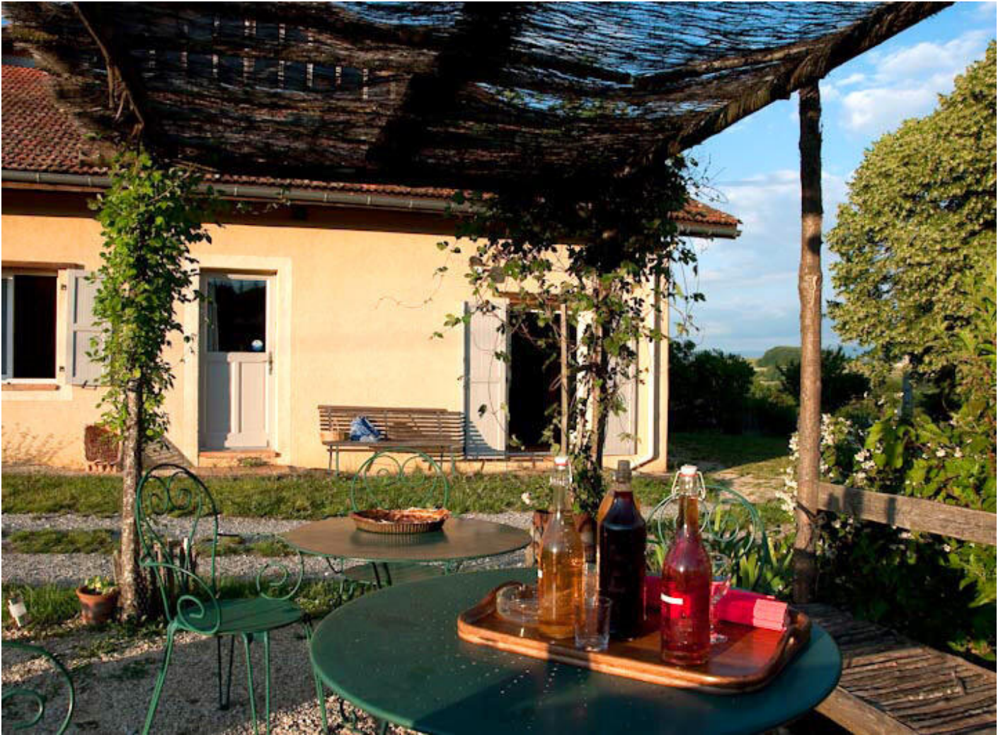
Table paysanne La Grange du Haut 38160 Saint-Antoine-l'Abbaye

Mes plats sont en adéquation avec mon éthique : ce sont donc des produits frais en concordances avec les saisons à majorités biologiques, transformés sur place.