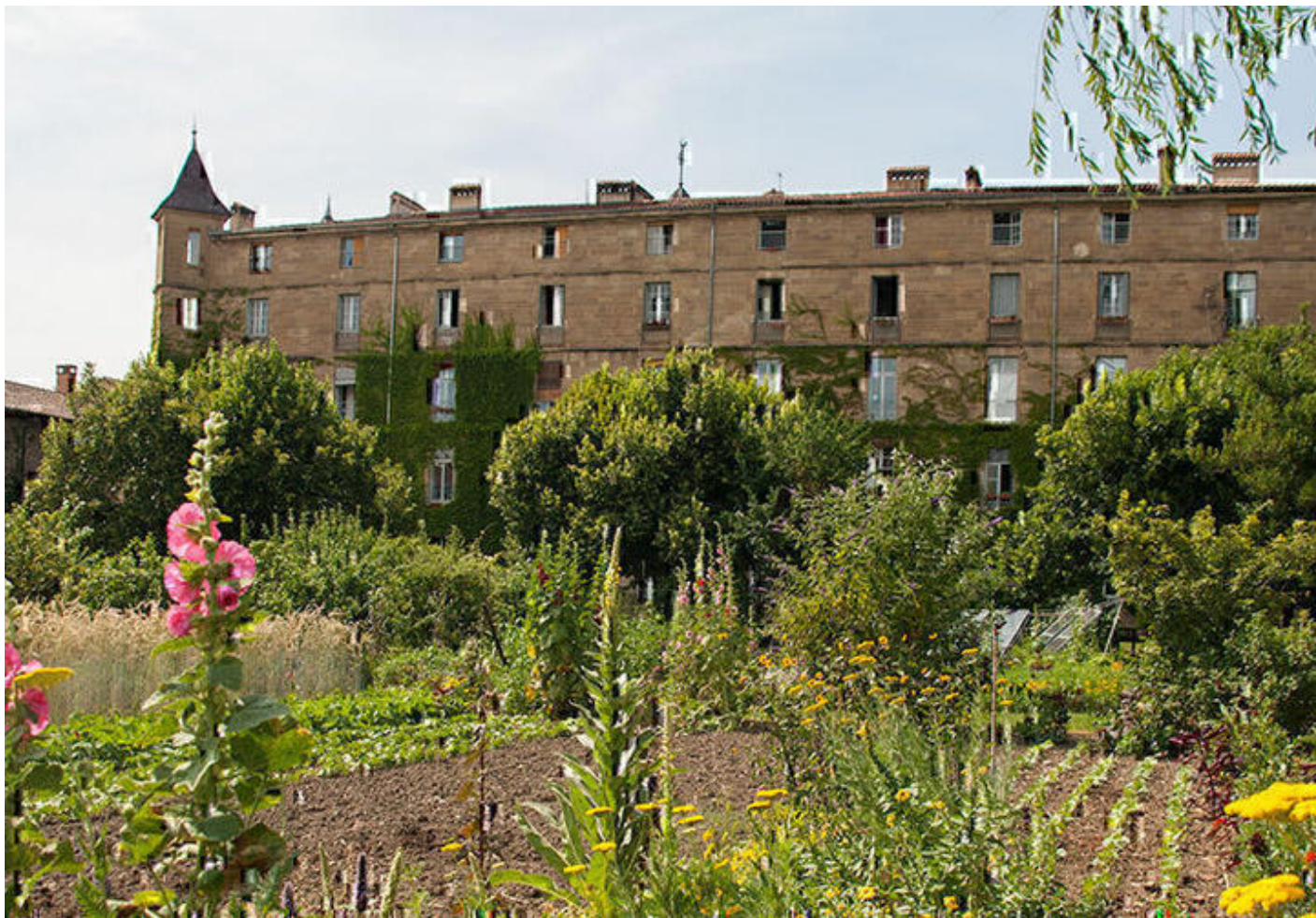
Maison d'accueil Arche de Saint-Antoine 38160 Saint-Antoine-l'Abbaye

Nous accueillons, dans une ambiance calme et chaleureuse, divers stages, retraites et évènements, ainsi que des séjours libres individuels, seul.e, entre ami-es ou en famille, pour vous ressourcer, vous former ou explorer de nouveaux chemins de découverte. Vous serez accueilli-es dans un grand bâtiment classé du village médiéval de Saint Antoine l'Abbaye, haut lieu historique et spirituel, labellisé Plus Beaux Villages de France, à une demi-heure du Vercors (Isère). Avec ses sept salles de formats variés, des repas de qualité faits maison, 99 places d'hébergement et ses jardins verdoyants, la Maison s'adapte aux saisons et aux différents groupes accueillis dans une atmosphère familiale.