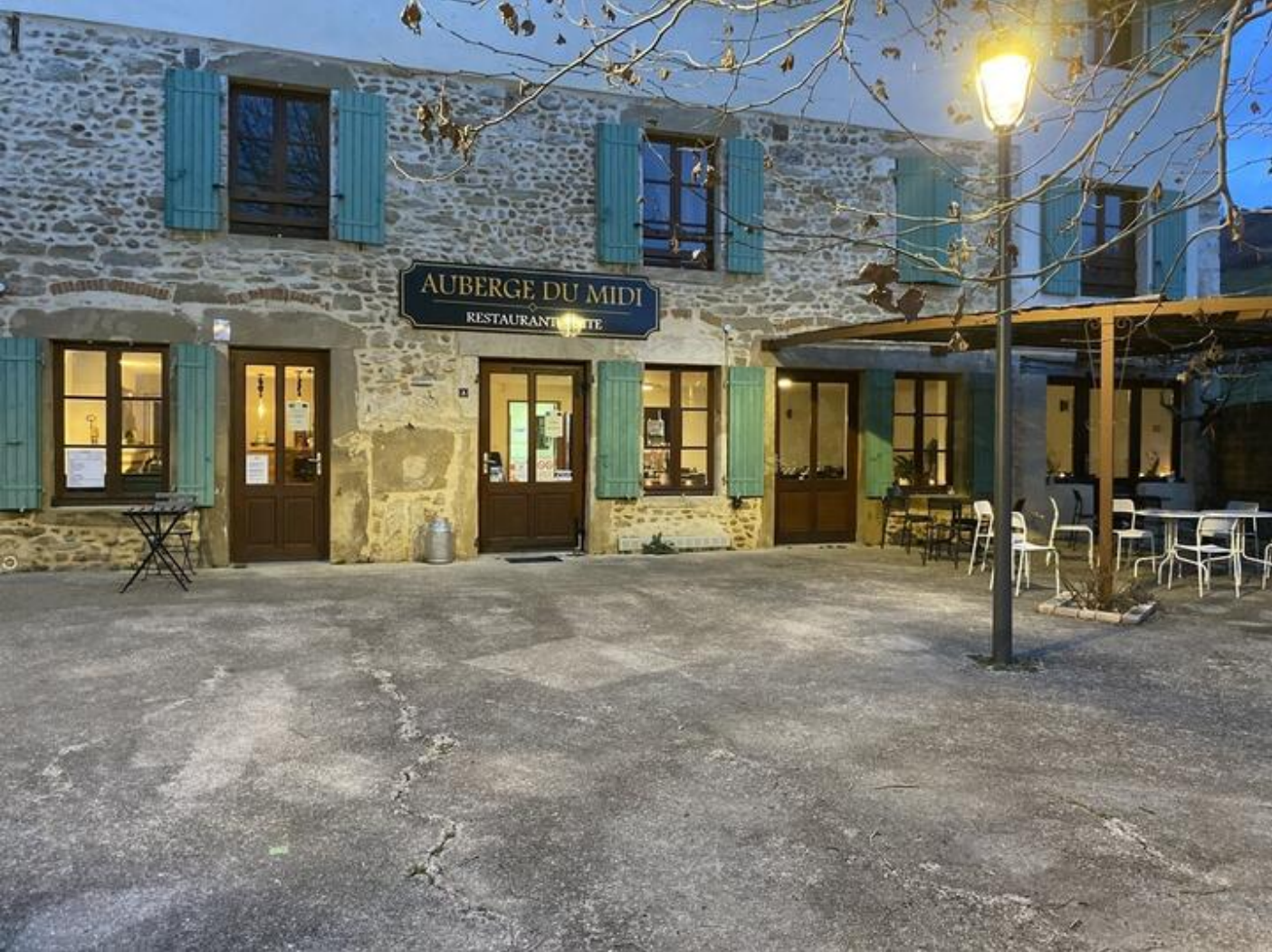
Auberge du Midi 38160 Saint-Antoine-l'Abbaye Notre cuisine vous accompagne à travers la découverte des spécialités culinaires de la région. Une cuisine qui se raconte de gourmands à gourmets.