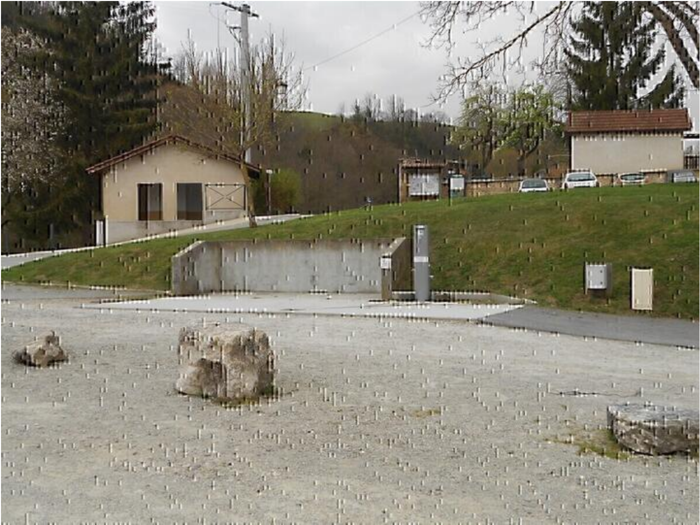
Aire de Service camping-car 38160 Saint-Antoine-l'Abbaye