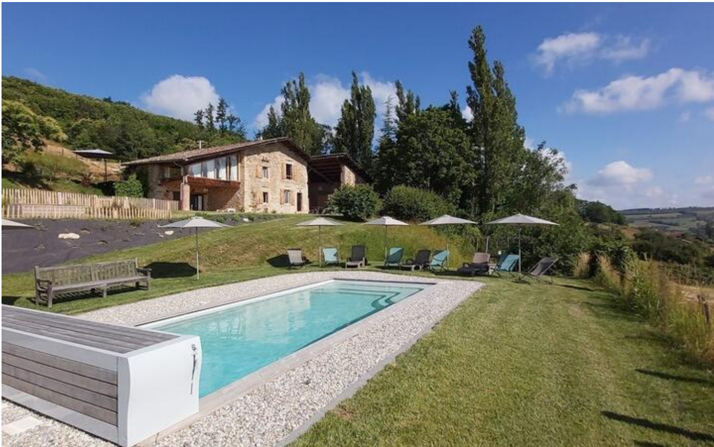
Gîte de Charme les Reynauds 38160 Saint-Antoine-l'Abbaye

Magnifique demeure de charme du 18 ème siècle, rénovée par architecte et parfaite pour vos week-ends, vacances, séminaires... Nichée tout en haut de la commune de Saint Antoine l'Abbaye, notre Gîte est située dans une zone naturelle protégée.