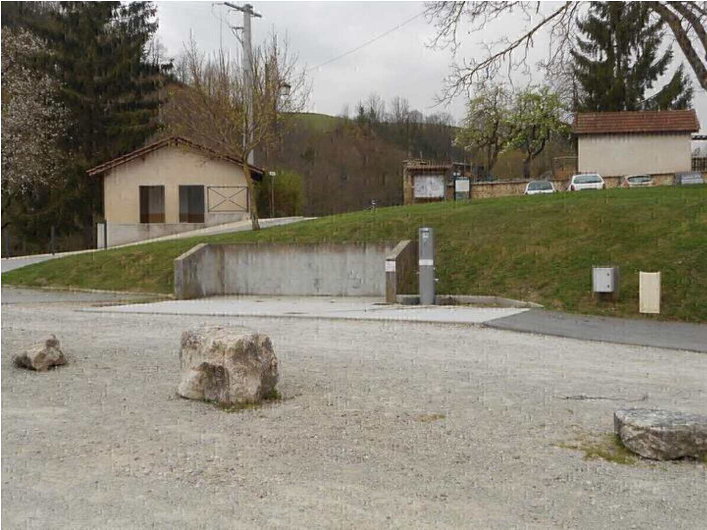
Aire de Service camping-car 38160 Saint-Antoine-l'Abbaye