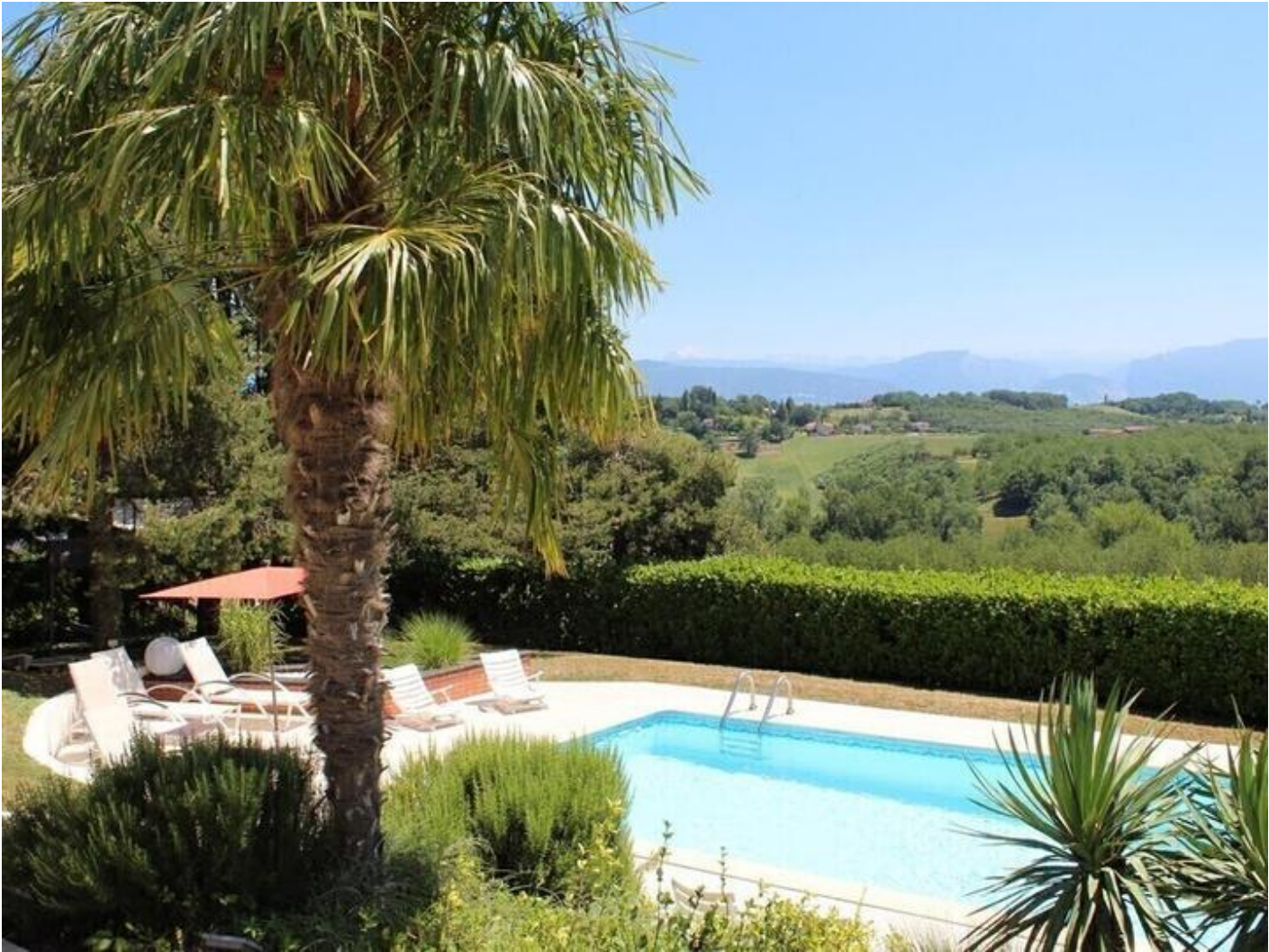
Les Genets 38160 Saint-Antoine-l'Abbaye