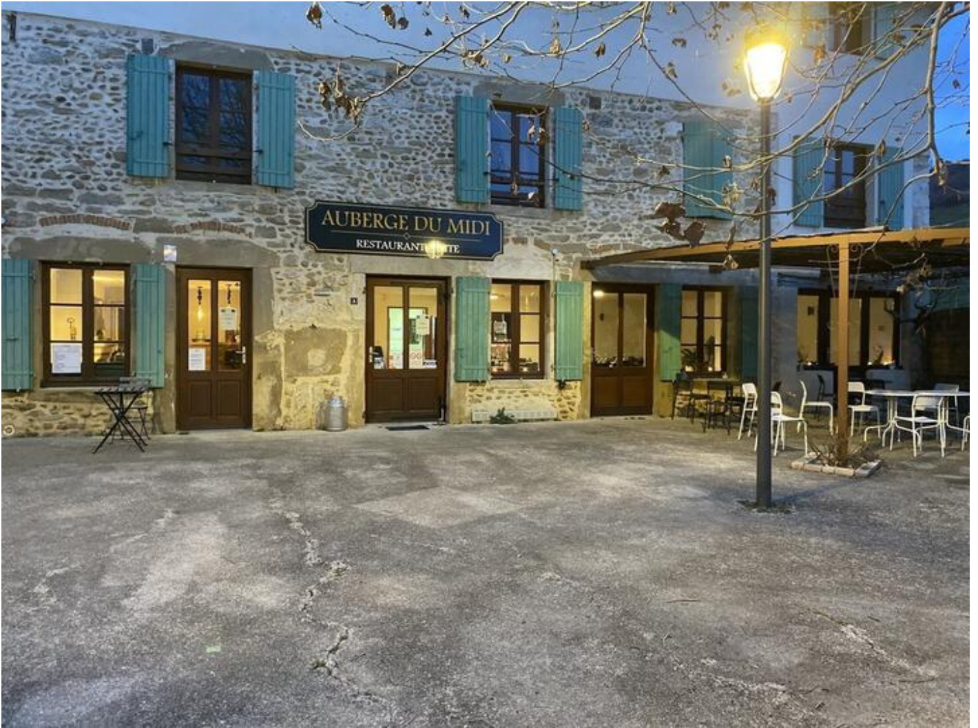
Auberge du Midi