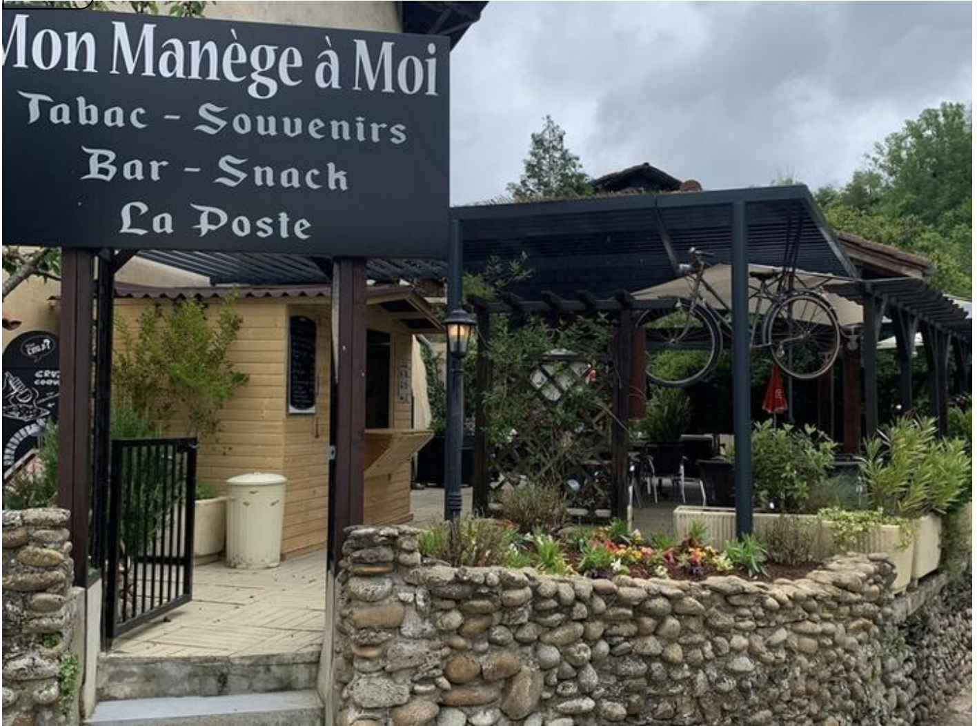
Mon Manège à Moi 38160 Saint-Antoine-l'Abbaye