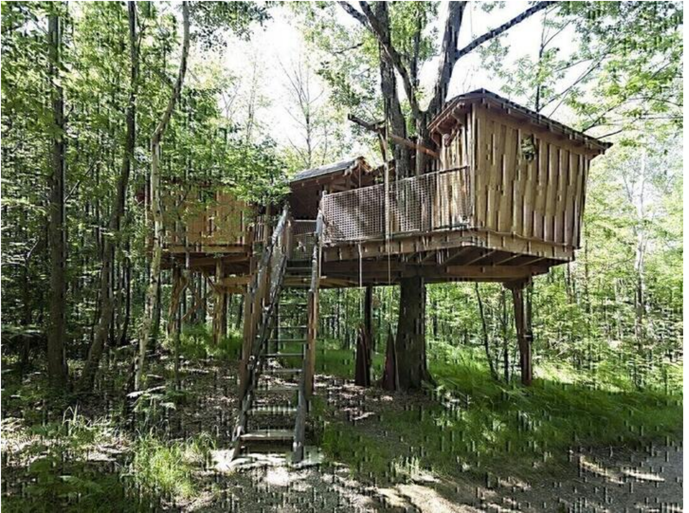
Les Cabanes de Fontfroide 38160 Saint-Antoine-l'Abbaye

Toutes nos cabanes sont équipées de toilette sèche, éclairage solaire, mobilier table chaises. Les cabanes sont à environ 80 à 100 mètres des blocs sanitaires. Aucun vis-à-vis entre les cabanes, chaque terrasse est exposée au sud. A votre disposition deux blocs sanitaires, un côté douches et un autre côté toilettes.