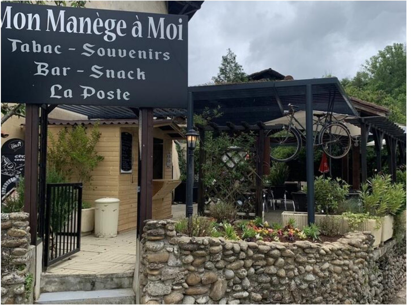
Mon Manège à Moi 38160 Saint-Antoine-l'Abbaye