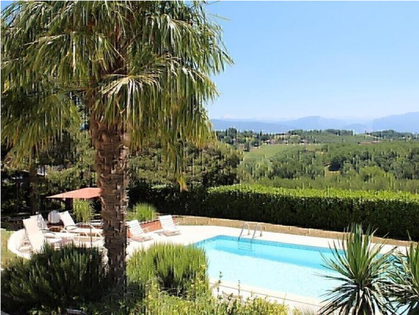
Les Genets 38160 Saint-Antoine-l'Abbaye d'infos