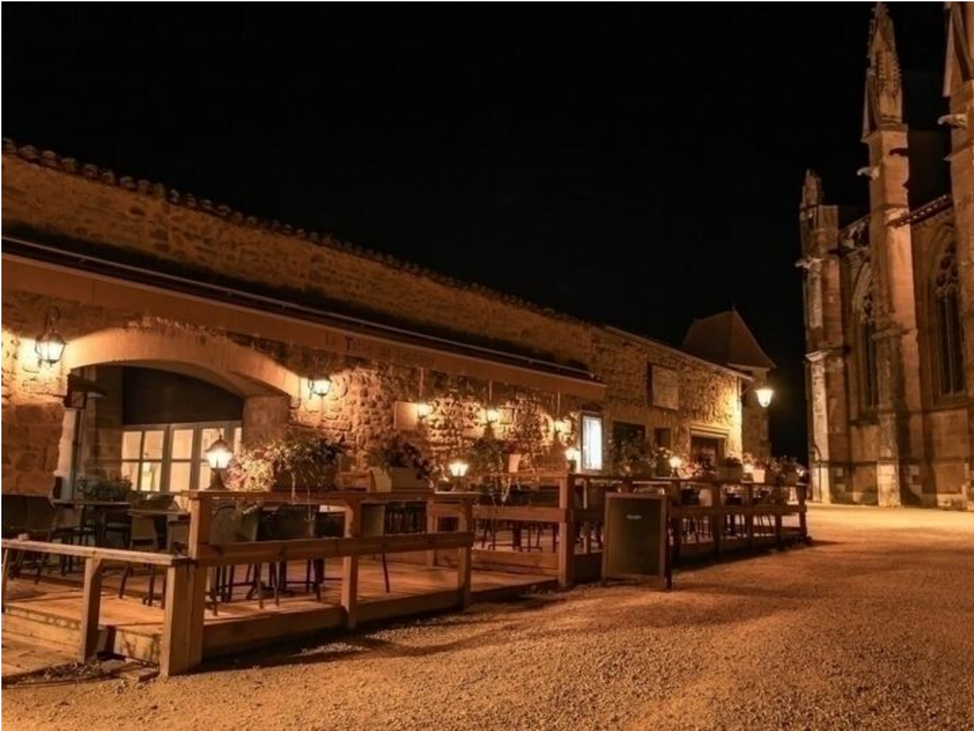
La Table de l'Abbaye 38160 Saint-Antoine-l'Abbaye d'infos