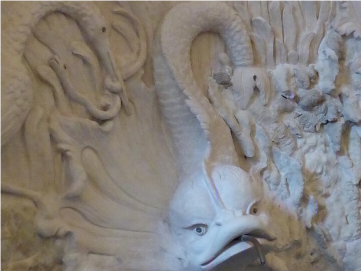
Visite guidée Saint-Antoine au fil du temps - Le temps de la curiosité : curiosités minérales ou a 38160 Saint-Antoine-l'Abbaye

Visite permettant de découvrir des espaces qui ne sont pas ouverts au public.