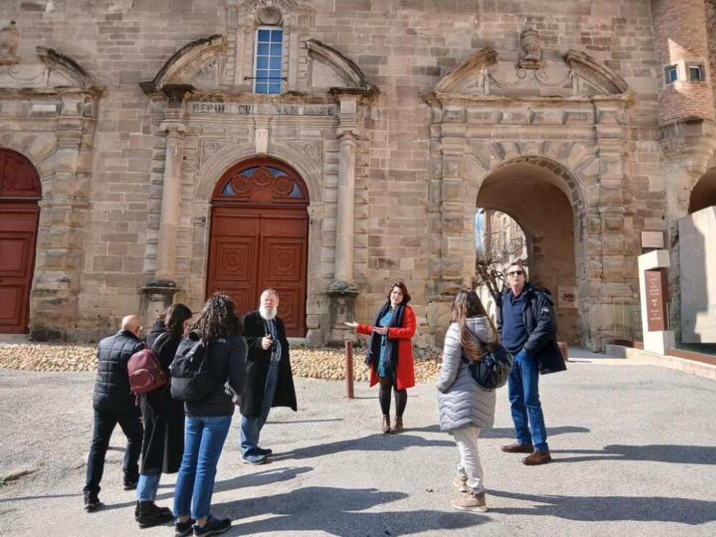
Visites guidées de Saint-Antoine-l'Abbaye | Eglise et Trésor 38160 Saint-Antoine-l'Abbaye

On raconte que nul ne vient à Saint-Antoine par hasard. Que ce soit l'histoire, le patrimoine, la passion du Moyen-Age ou la curiosité qui aient guidé vos pas, Saint-Antoine-l'Abbaye vous invite à découvrir ses secrets et son histoire millénaire.